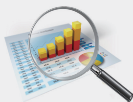
全省自然资源情况表